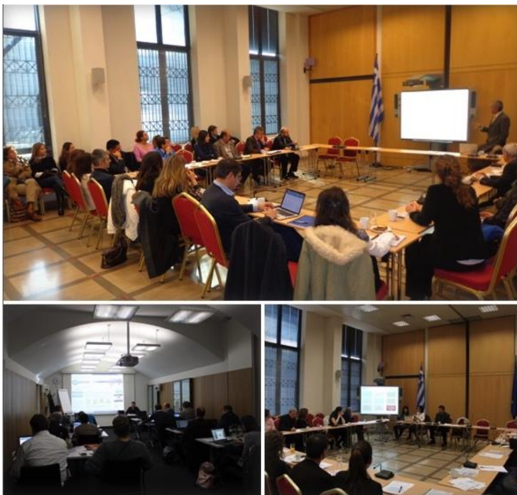
Παρουσίαση του NOMAD στο Ελληνικό και Αυστριακό Κοινοβούλιο

Η μεθοδολογία και τα εργαλεία του NOMAD, που αυτή τη στιγμή βρίσκονται στη φάση ολοκλήρωσης των, παρουσιάστηκαν και αξιολογήθηκαν σε τρεις διαδοχικές συναντήσεις, οι οποίες έλαβαν χώρα στο Ελληνικό και στο Αυστριακό Κοινοβούλιο (12, 18 και 25 Νοεμβρίου). Στις συναντήσεις αυτές συμμετείχαν συνολικά 60 άτομα, ανάμεσα τους κοινοβουλευτικά στελέχη, επιστημονικοί συνεργάτες βουλευτών και κομμάτων, δημοσιογράφοι, μέλη ΜΚΟ, σύμβουλοι επιχειρήσεων. Σημαντική ήταν η εκπροσώπηση του Ελληνικού δημόσιου τομέα, αφού παρευρέθηκαν φορείς όπως η Γενική Γραμματεία της Κυβέρνησης , η Γενική Γραμματεία Συντονισμού του Κυβερνητικού Έργου , 5 Υπουργεία ( Διοικητικής Μεταρρύθμισης , Αγροτικής Ανάπτυξης , Παιδείας , Δημόσιας Τάξης , Ναυτιλίας ), η Γενική Γραμματεία του Ελληνικού Κοινοβουλίου , ο Δήμος Αθηναίων , η συνεισφορά των οποίων ήταν η σημαντική στη συζήτηση για την υιοθέτηση και αξιοποίηση εργαλείων πληροφορικής όπως το NOMAD, στις καθιερωμένες διαδικασίες τους.